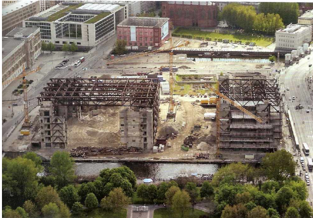
Abbildung aus dem beschriebenen Buch: Bauakademiesimulation am Schinkelplatz; im Vordergrund: Baustelle des Berliner Schlosses (Humboldt Forum) statt Abbildung in der FAZ (Fischerkiez 1971)

8. August 2018, Robert Kaltenbrunner: Die Altstadt als Kampfplatz Modernisierung durch Zerstörung: Benedikt Goebel erkundet das Schicksal von Berlin Mitte und schärft dabei den Blick für Tendenzen der Stadtentwicklung